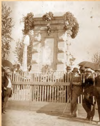
Gábor Áron emlékmű, 1891

Az írás eredetileg az alábbi helyen jelent meg: Gábor László: Gábor Áron (1814–1849). Öntöde, 36. (118.) évf., 1985 (11.) szám