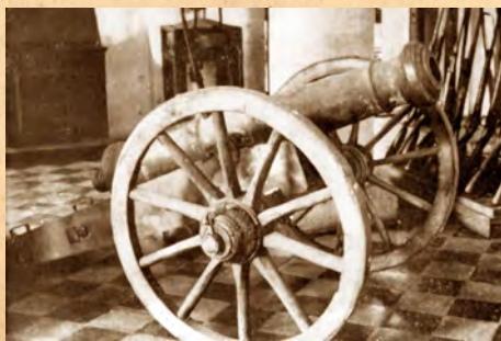
Gábor Áron 1906-ban megtalált ágyúja

Gábor Áron az első ágyúit Erdővidéken, a Magyarhermány melletti Bodvajban öntötte nagyon jó minőségű helyben bányászott vasból. Az ágyúk elkészítése és Sepsiszentgyörgy főterén történt bemutatása után Gábor Áron nem ment vissza Bodvajba. Hírszerzőitől megtudta, hogy az osztrákok Háromszék megtámadására készülnek, ezért Sepsiszentgyörgyön Kiss János harangöntő műhelyében folytatta az ágyúk öntését, majd véglegesen Kézdivásárhelyre helyezte át műhelyét, itt Turóczi Mózes vezetésével kiváló iparos mesterek segítettek munkájában. Turóczi Mózes műhelyében 66 darab három és hatfontos ágyú készült. A szabadságharc ideje alatt Gábor Áron és segítői összesen 73 ágyút