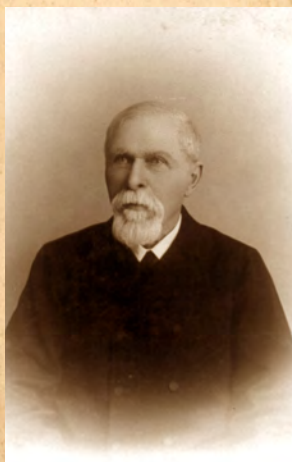
Tuzson János idős kori képe

Tuzson János honvédőrnagyot a nyerges-tetői csata hőseként tartja számon a szabadságharc története és a köztudat. Az ott lezajlott hősi küzdelem szervezése és irányítása az akkor mindössze 24 éves fiatal parancsnoknak valóban a legjelentősebb hadvezéri tette volt. Ezt a csúcsot katonai pályafutása során alapos felkészülés és számos kiváló haditett előzte meg.