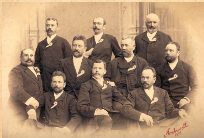
A sepsiszentgyörgyi Kossuth-küldöttség

1849. március 24. jelentős nap volt Sepsiszentgyörgy életében, a városba látogatott Bem József, akit nagy lelkesedéssel fogadtak. A székház ablakából jelentette ki, hogy Háromszék hősét, a székely tüzérség létrehozóját, Gábor Áront századossá nevezte ki. A város halála és tisztelete jeléül Bem Józsefnek és Kossuth Lajosnak telket