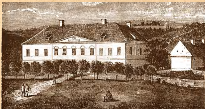
Nemzet háza (Orbán Balázs nyomán)

„Bizony nem lehetne elszámolni, mennyit tett vén és ifjú, férfi és nő és mindenki...” – ezekkel a sorokkal fejezte ki a tudósító azt az áldozatvállalást, amit Sepsiszentgyörgy polgársága vállalt magára 1848 októberétől kezdődően, de elsősorban decemberben, Háromszék önvédelmi harca idején. A híradás Bem József 1849. március 24-i sepsiszentgyörgyi látogatása kapcsán a Honvéd 1849. április 5-i 84. számában látott napvilágot. A tudósítást a legilletékesebb, Demeter József városi főbíró, majd országgyűlési követ, a „háromszéki tábor” főélelmező biztosa írta: