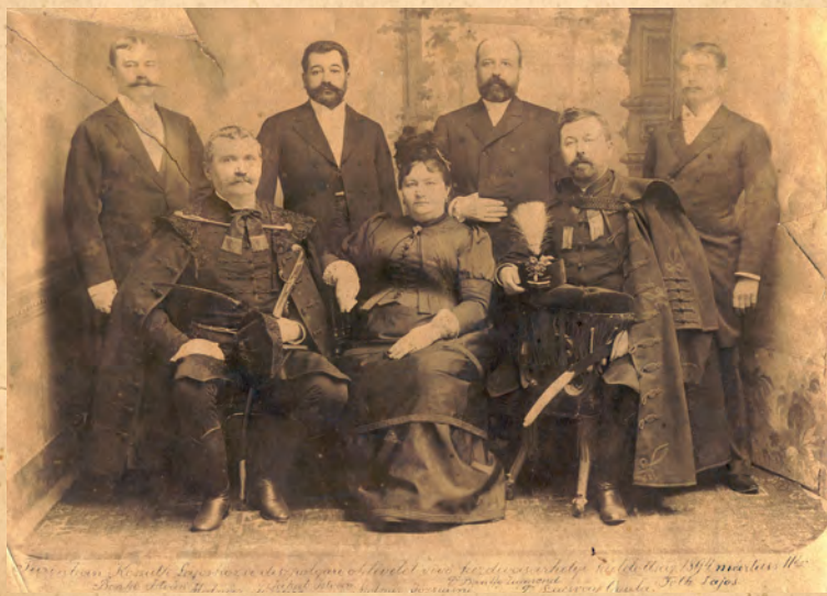
A kézdivásárhelyi Kossuth-küldöttség

Az írás eredetileg a Felső-Háromszék a szabadságharcban című kiadványban jelent meg. Media Design & Print, 1999, szerk. Kocsis Károly