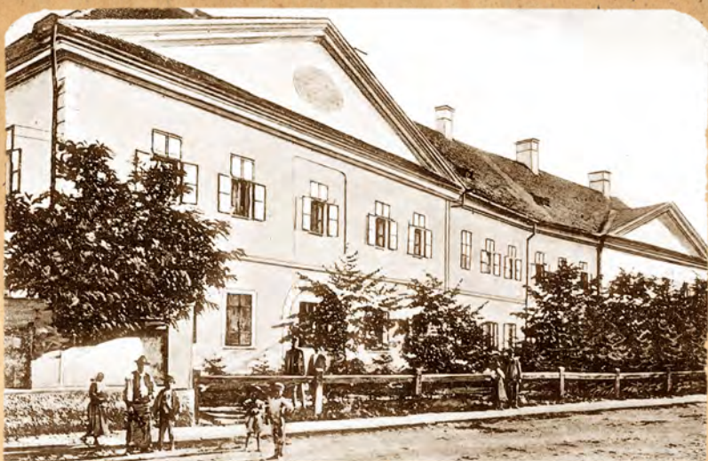
Katonanevelde a 19. század végén

Kézdivásárhelyen 1823-ban nyílt meg a Székely Katonanevelde, ahol, akárcsak a csíkszeredai hasonló intézményekben, a hadapródok és tanáraik, az ott tanító tisztek olvasótársaságot szerveztek, magyar hírlapokat és könyveket szereztek be, és az olvasókörökben megvitatták azokat az új eszméket, amelyeket a reformmozgalom hívei meghirdettek. Az osztrák katonai hatóságok felfigyeltek ezekre, s mivel veszélyesnek tartották, fel is számolták az olvasótársaságokat. Az új eszmék terjedését azonban nem tudták megakadályozni. Nem