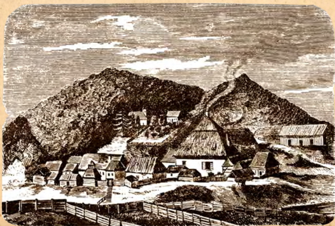
A bodvaji vashámor (Orbán Balázs nyomán)