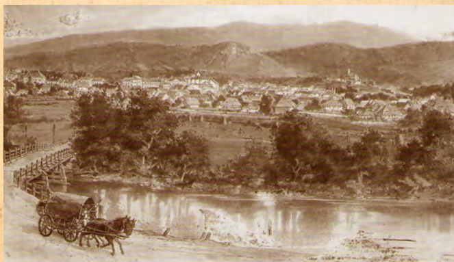
Eprestető a 19. század végén